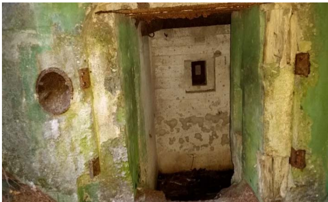
Bild: Innenansicht Westwall Bunker bei Hürtgen

Die Veranstaltung findet jährlich im Mai und im September statt.