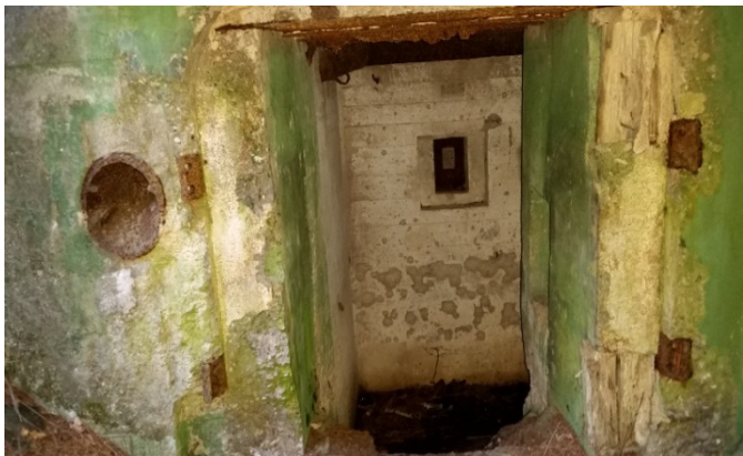
Bild: Innenansicht Westwall Bunker bei Hürtgen

Geführte Wanderungen finden jährlich im Mai und im September statt.