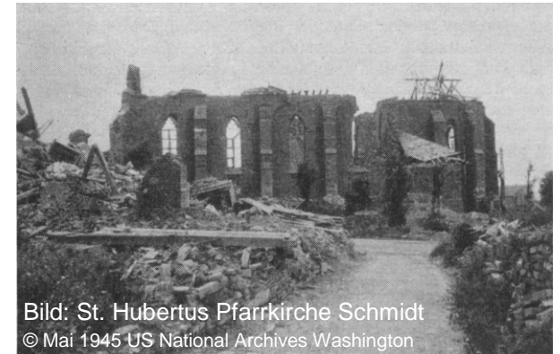
Bild: St. Hubertus Pfarrkirche Schmidt © Mai 1945 US National Archives Washington

Militärhistorischer Arbeitskreis Reservistenarbeitsgemeinschaft (RAG) Marine Euskirchen Marinekameradschaft (MK) Euskirchen von 1927 Reservistenkameradschaft (RK) Euskirchen