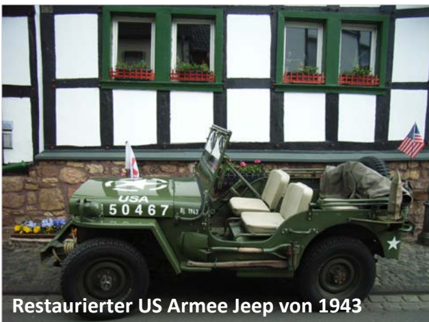
Restaurierter US Armee Jeep von 1943