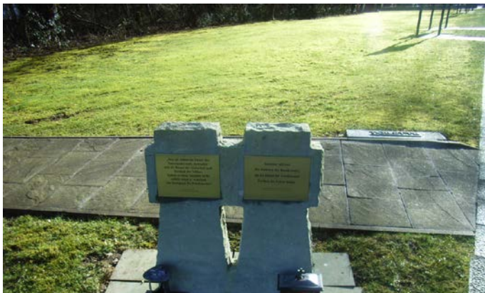
Bild: Gedenksteine auf der Höhe 470

Dem Gedenken an die Opfer, der Völkerverständigung und der Mahnung zum Frieden sollen die Wanderungen auf historischen Wegen auch mehr als 75 Jahre nach dem Ende der Auseinandersetzung erinnern.